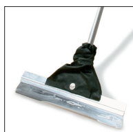
10 Osmo Stålspackel