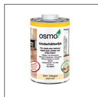
4 Osmo Underhållsolja