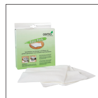
5 Osmo Easy Pad