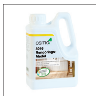
1 Osmo 8016 Rengöringsmedel