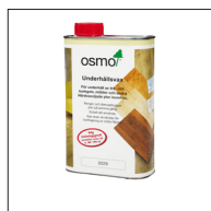
3 Osmo 3029 Underhållsvax