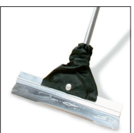
10 Osmo Stålspackel