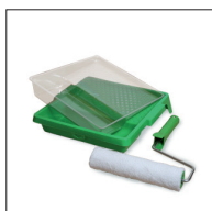
9 Osmo Mikrofiberroller