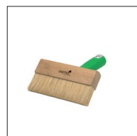
8 Osmo Penselborste