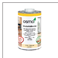
4 Osmo Underhållsolja