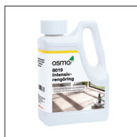
2 Osmo 8019 Intensivrengröring