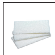
6 Vit skurnylon