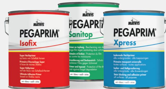
Pegaprim® Xpress - Pegaprim® Isofix - Pegaprim® Sanitop

Grunda med PEGAPRIM® För ett lyckat målningsjobb!