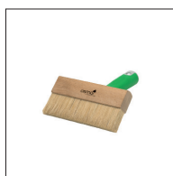
Osmo Penselborste med handtag