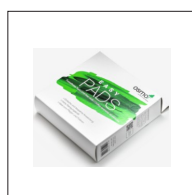
Osmo Easy pad