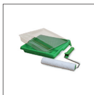
Osmo Mikrofiberroller 100 mm