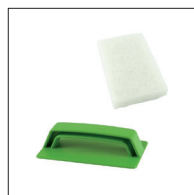
Osmo Vitt Skurblock Mini + hållare