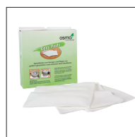
Osmo Easy Pad