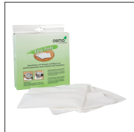
Osmo Easy Pad