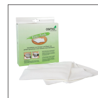
Osmo Easy Pad luddfri trasa