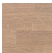
3440 Vit, sidenmatt på ek

De avbildade kulörerna fotograferade och endast vägledande. Det finns alltid risk för att färgavvikelse uppkommer vid tryckning av broschyrmaterial.