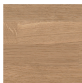
3098 Ofärgad, halvmatt m. R9 på ek